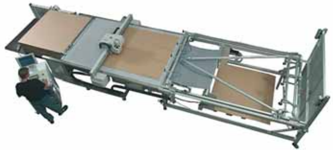
La Kongsberg Digital Converting Machine de Esko.