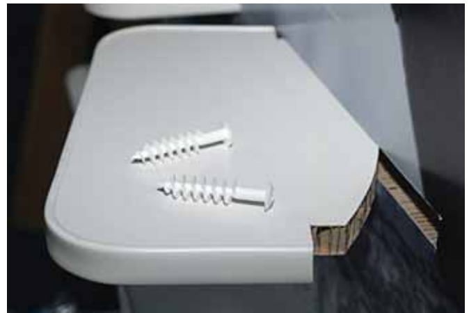
Re-board permite instalar tornillos.